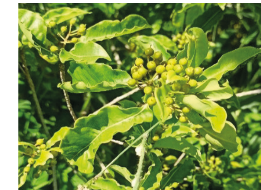
Bois de joli cœur Pittosporum senacia