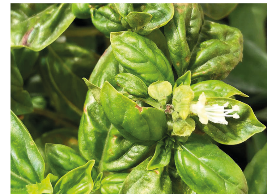
Basilic Ocimum basilicum L.