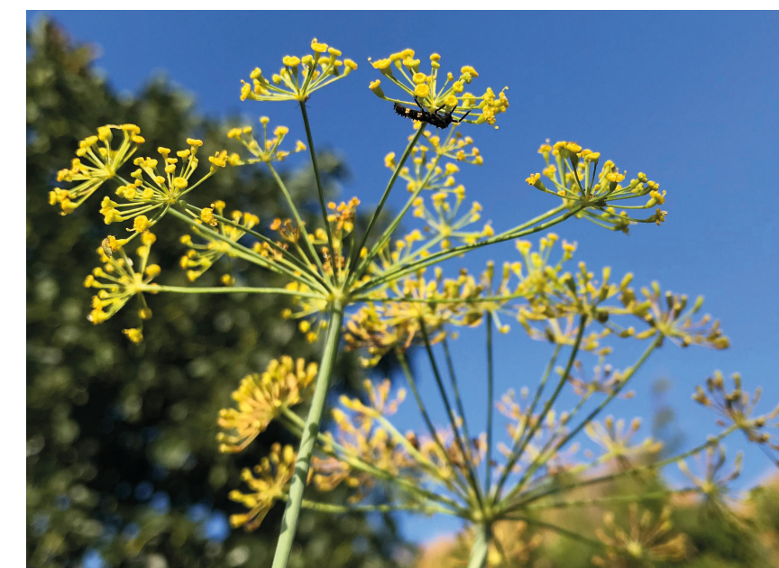
Aneth Anethum graveolens