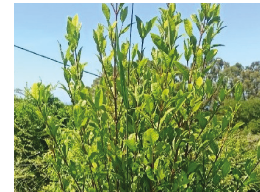
Bois de prune rat Myonima obovata

Dans notre étude, elles sont composées de plusieurs espèces végétales endémiques des Mascareignes telles que :