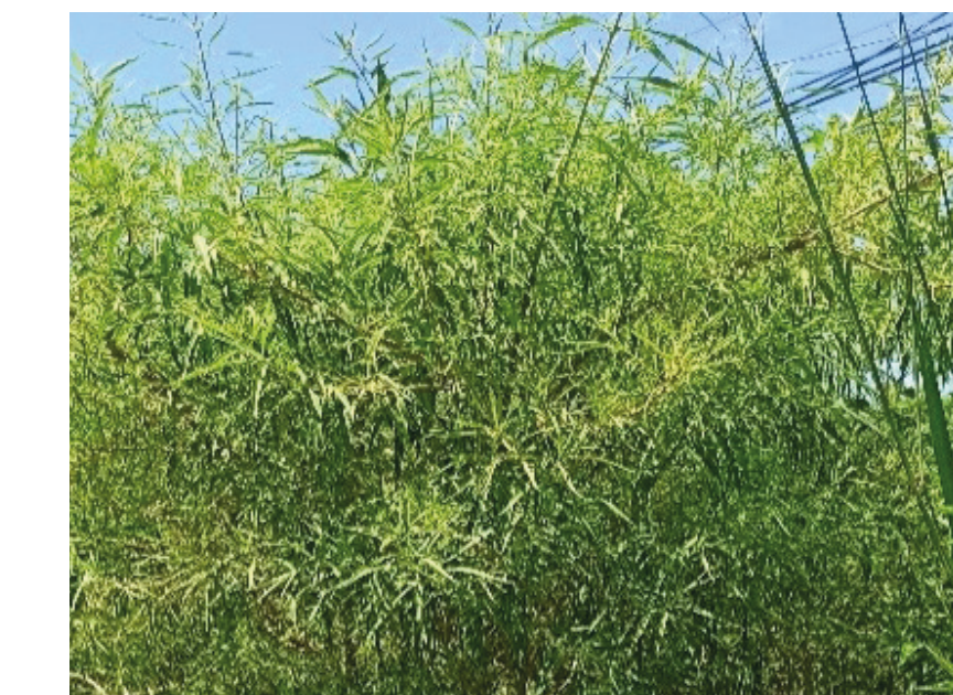
Bois de chenille Clerodendrum heterophyllum