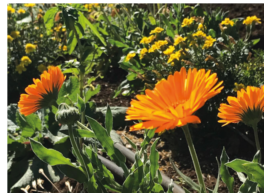
Soucis Calendula officinalis

Dans notre étude, elles sont composées de plusieurs espèces végétales telles que :