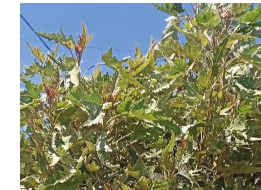
Bois de senteur blanc Ruizia cordata